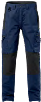
126515-598 SERVICE STRETCH-HOSE 2700 PLW