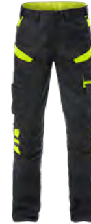
129482-982 HOSE 2555 STFP