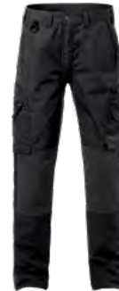
126515-940 SERVICE STRETCH-HOSE 2700 PLW