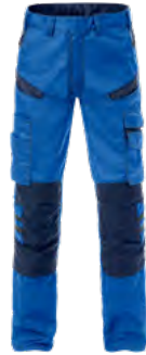
129482-676 HOSE 2555 STFP