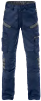
129482-586 HOSE 2555 STFP