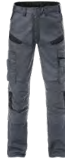
129482-896 HOSE 2555 STFP