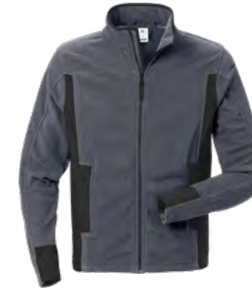
120966-896 FLEECEJACKE 4003 MFL