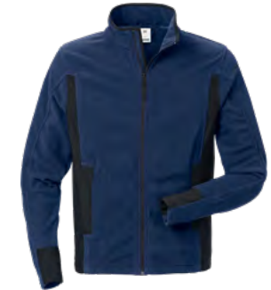
120966-598 FLEECEJACKE 4003 MFL