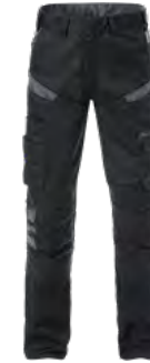
129482-996 HOSE 2555 STFP