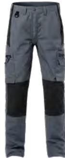
126515-896 SERVICE STRETCH-HOSE 2700 PLW