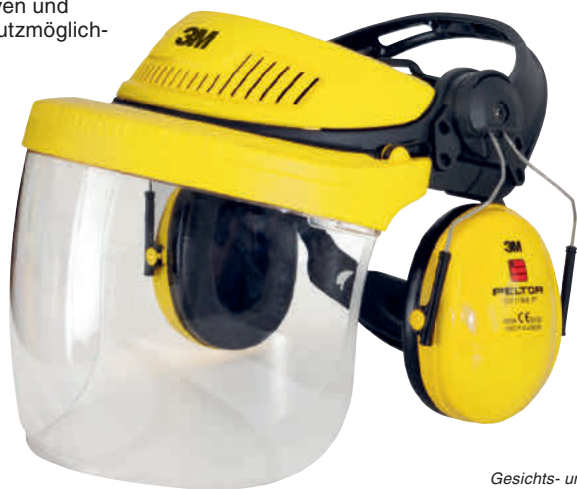
Gesichts- und Gehörschutzkombination Art.-Nr. 5V5F1H51